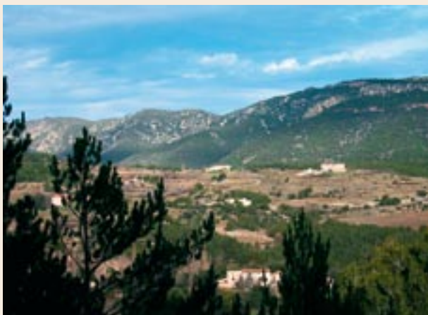
Masos de la Cadeneta