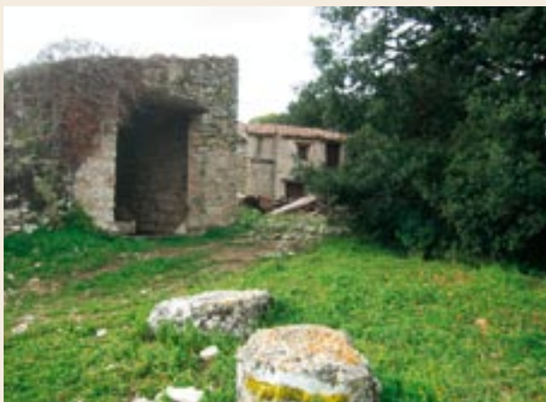
Mas d'en Verd