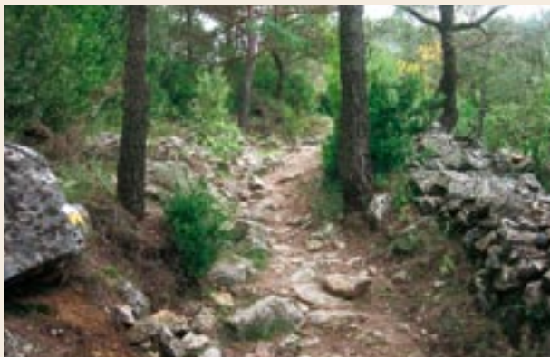
Señales de PR

(Rafael López-Monné. A peu per les comarques de Tarragona. Vol. 1, Col·lecció de Ferradura, Arola Editors, 2005.)