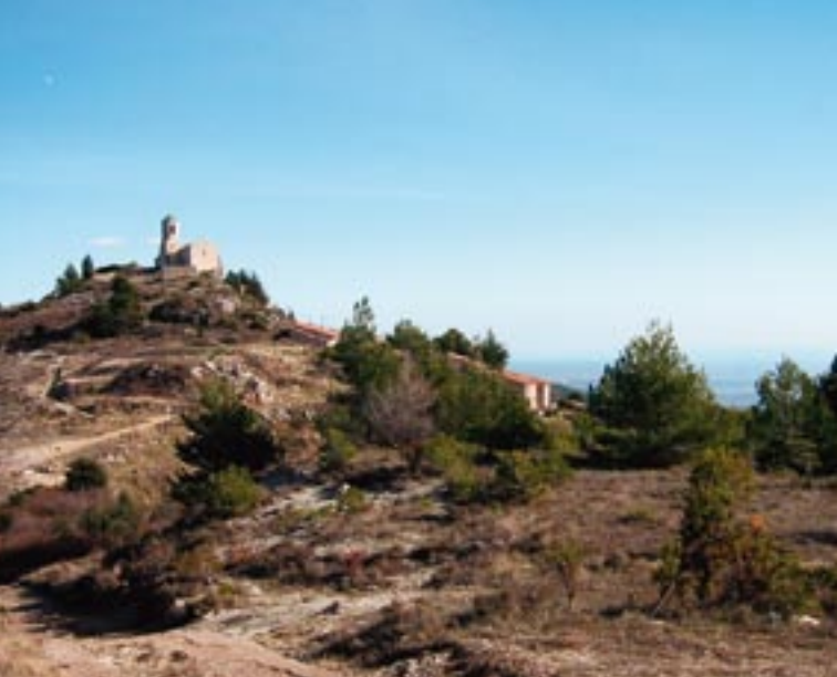
El pueblo de Mont-ral