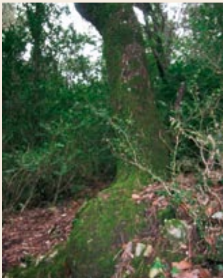
A través de un bosque sombrío