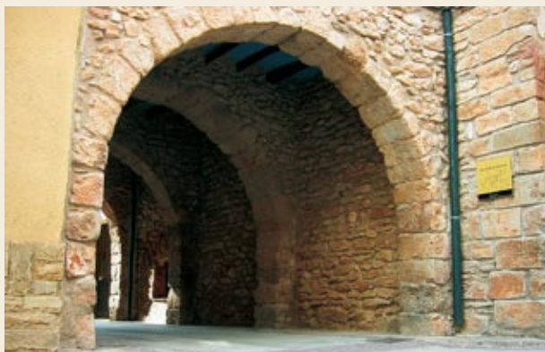
Portal de la calle Trinitat del Pla, cerca del Ayuntamiento

Plaza de la Vila (388 m), presidida por el edificio del Ayuntamiento. Final de la excursión.