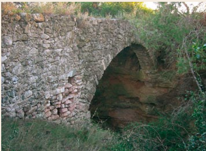
Pont del Diable o del Moro, en el barranco de los Masos