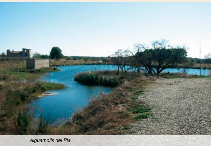
Aiguamolls del Pla

Aiguamolls del Pla (323 m). Dejamos el camino más trillado y decantamos a la derecha hacia la caseta de observación de aves que se encuentra a ras de la laguna. Para poder observar los pájaros es importante no hacer ruido. Los Aiguamolls del Pla han surgido de las aguas de la depuradora de aguas residuales del pueblo y del polígono. Son pantanales únicos en el Alt Camp y se han convertido en punto de parada de numerosos pájaros (destacan importantes especies protegidas).