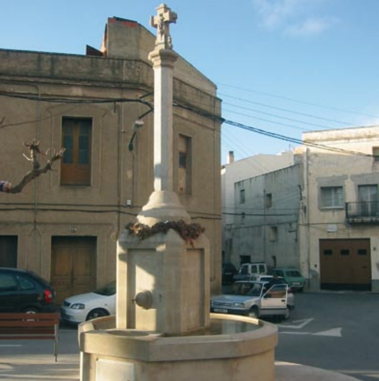
Fuente de la plaza de Jacint Verdaguer o del Soldevila