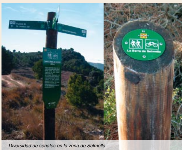
Diversidad de señales en la zona de Selmella

Parece que las primeras fortificaciones del castillo se construyeron a finales del s. X y fueron devastadas por los sarracenos en la razia de Almanzor del año 985, el cual atacó buena parte de las fortalezas de la frontera — río Gaià — con el condado de Barcelona. Pero las primeras noticias documentadas sobre el castillo son del año 1011, en un juicio donde se disputan la propiedad del castillo la familia Cervelló y los señores de Santa Perpètua.