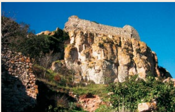
Restos del castillo de Selmella

A mediados de siglo XIX, Selmella era parte del municipio del Pont d'Armentera, a pesar de mantener una identidad propia. Como población de su término se mencionan sólo trece masías habitadas, con un total de 69 habitantes. El primer decenio del siglo XX todas las casas todavía estaban de pie, pero en 1952 sólo quedaba una habitada. Su situación, los pocos campos de cultivo situados por estos pagos, la falta de buenas comunicaciones y el aislamiento general de la zona hicieron que sus pobladores buscaran mejores condiciones de vida.