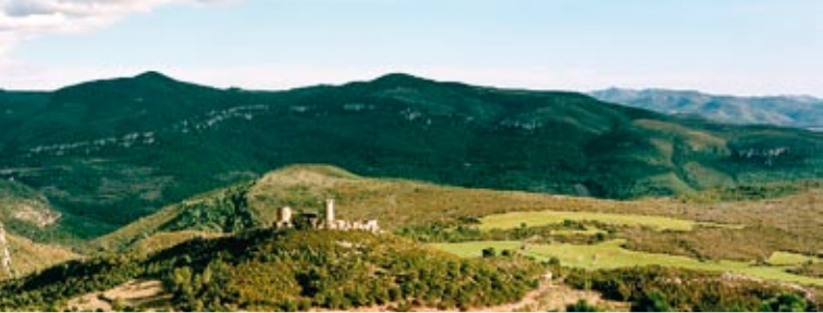
El castillo de Saburella