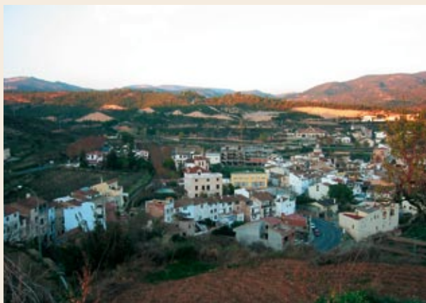
El Pont d'Armentera

Bifurcación de pistas (600 m). Seguimos la pista que sube. La de la derecha nos permitiría llegar al río Gaià y al Pont d'Armentera por los barrancos de Batllet, Rosic y el Pendot.