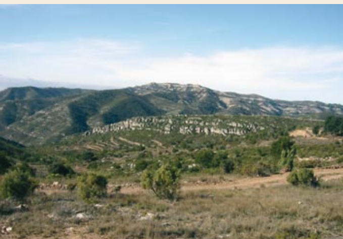
La línea de cresta del Cogulló desde el castillo de Selmella

Pista a la izquierda. Seguimos recto por una pista en buen estado y dejamos la que sale a mano izquierda.