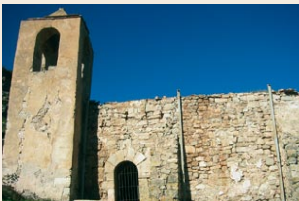
Iglesia de Sant Llorenç