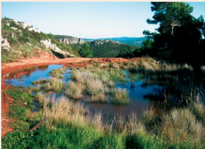
Charco de agua en la parte posterior del castillo de Selmella

En los s. X y XI los castillos más antiguos e importantes de toda la línea defensiva del Gaià se habían construido en la orilla izquierda del río; el de Selmella, en cambio, es de las primeras fundaciones situadas en la orilla derecha, en un claro intento de penetración hacia la zona de la Conca de Barberà, en manos sarracenas.