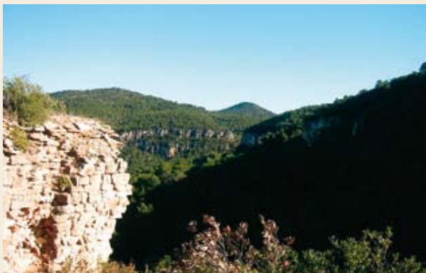
El cono de Montagut desde la ermita de Sant Salvador