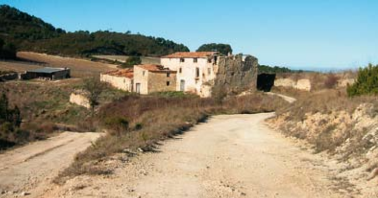
Masía de cal Boada