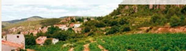
Panorámica de Querol

Giro de 180° (632 m). El camino gira 180° y toma la dirección noroeste. Pasa agarrado bajo el risco del Coster del Moneu. Seguimos subiendo y nos encontramos con una magnífica panorámica de la Serra de Miramar y buena parte del