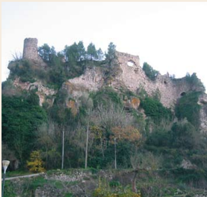
El castillo de Querol

Querol (565 m). Dejamos la carretera justo a la entrada del pueblo para girar por la calle de la derecha hacia el lavadero público. Podemos seguir a la derecha hasta el área recreativa de la Font de Querol o seguir a la izquierda por la calle Andorra. Llegamos a la plaza de Sant Sebastià, desde donde podremos dar una vuelta hasta la parte alta del pueblo, lugar en el que se encuentran los restos del castillo de Querol y de la iglesia de Santa Maria. Se trata de un pequeño edificio construido durante diferentes épocas, de una sola nave, vuelta seguida de arco apuntado y campanario cuadrado con ventanas de punto redondo y acabado en una cubierta piramidal.