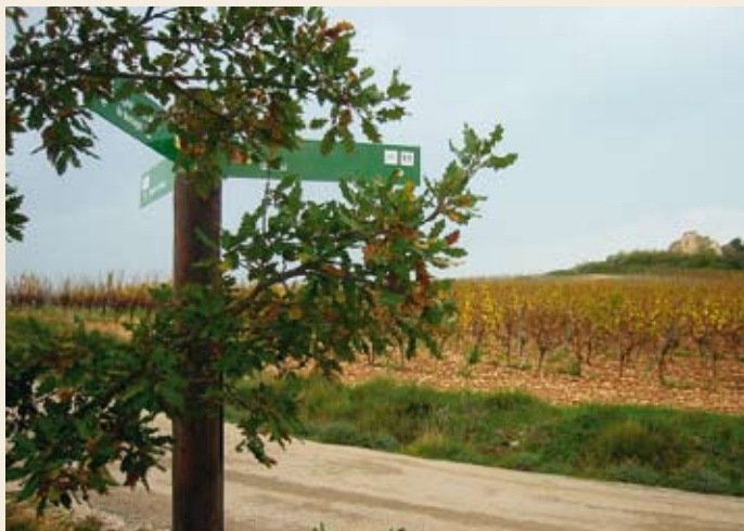
Coll de Montagut. Al fondo, cal Rovira

Viñedos. Llegamos a un terreno con cepas emparradas que parece que nos quieran cortar el paso. Debemos seguir las roderas de los coches hacia el noreste y ladear la parada de