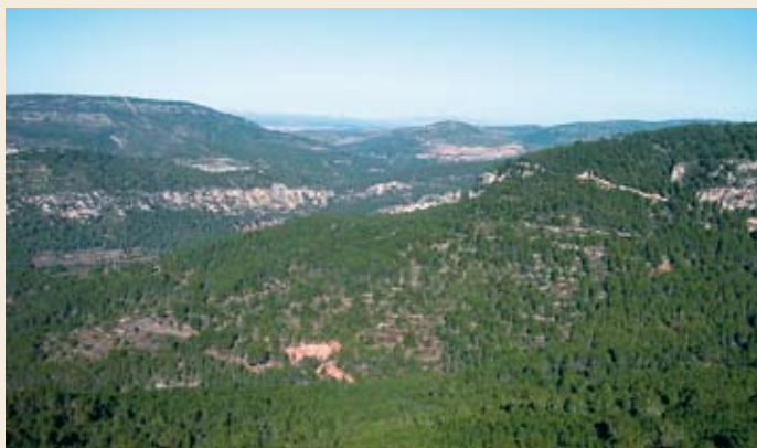
El valle del Gaia

Cadena. En los laterales del camino encontramos dos bigas de hierro de color verde que aguantan una cadena. A pesar de que casi nunca se encuentra cerrada, hay que extremar